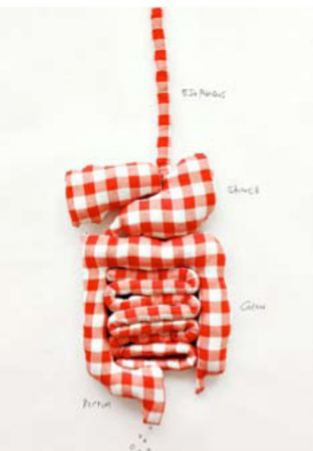
Inner inside, 2008, fotografia digitale, cm 60x80