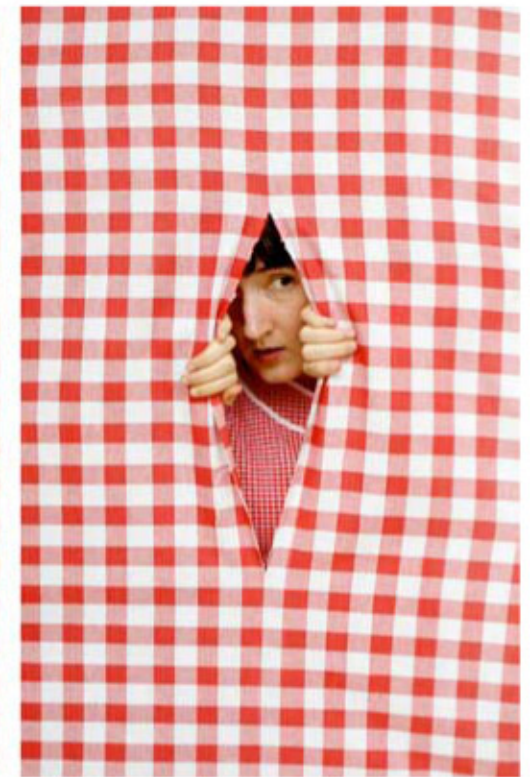
lo taglio tu tagli , 2008, stampa su tessuto, tre stampe cm 70x100

CS/ Feuerbach scrisse "l'uomo è ciò che mangia", prospettando un rapporto tra psiche e corpo. Questo nesso è anche alla base di queste tue opere?