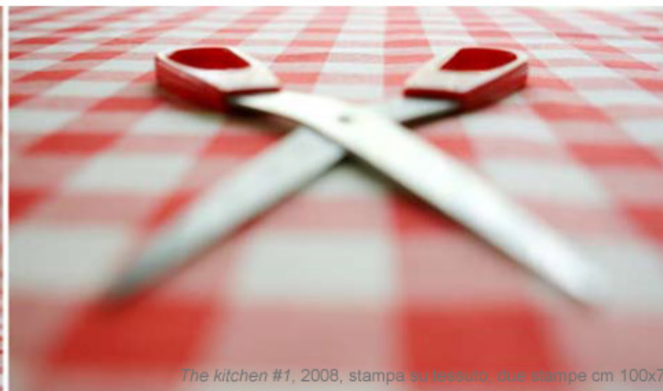
The kitchen #1, 2008, stampa su tessuto, due stampe cm 100x70