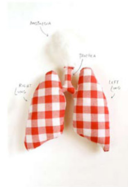
Nostalgia, 2008, fotografia digitale, cm 60x80