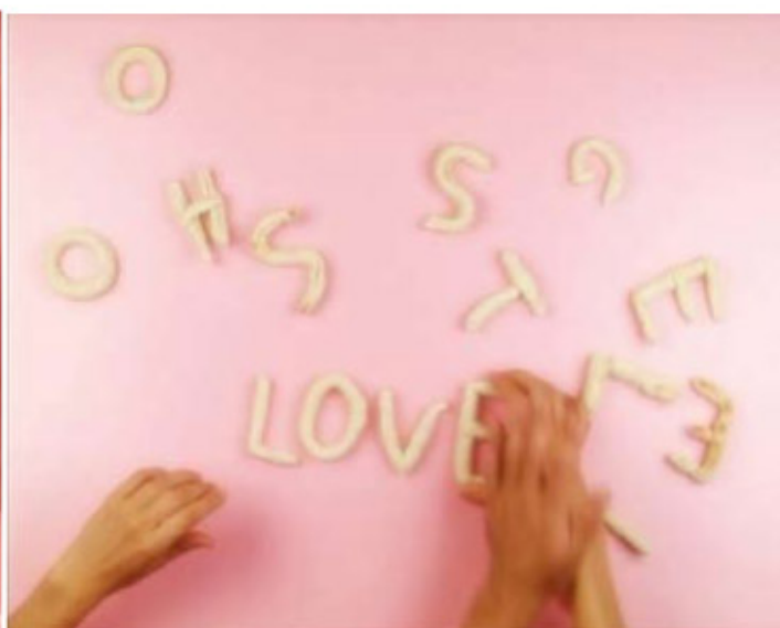
Something wrong Natalia Saurin & Silvia Levenson 2005, still da video