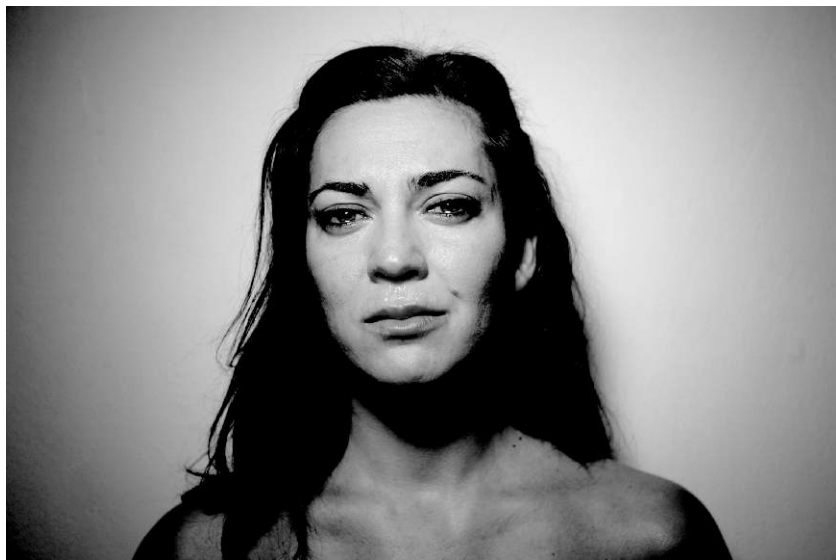
© Juanma Carrillo "To play at crying"